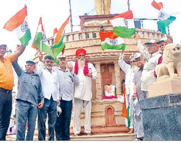
गोहाना। हाथों में राष्ट्रीय ध्वज तिरंगा लेकर पिगली वैकैया को नमन करते नागरिक।

सांस्कृतिक प्रतियोगिताएं, जनसंपर्क गतिविधियां एवं डिजिटल भागीदारी जैसे अनेक आयोजन किए जाएंगे। आयोजनों में शैक्षणिक संस्थानों, युवाओं, एनजीओ, खेल जगत के लोगों, 'माय भारत' के स्वयंसेवकों, एनएसएस, एनसीसी, आरडब्ल्यू तथा आम जनता की सक्रिय भागीदारी सुनिश्चित की जाएगी। इस वर्ष अभियान में कुछ नई गतिविधियां भी जोड़ी गई हैं, जैसे 'तिरंगा राखी निर्माण', 'जवानों व पुलिसकर्मियों को पत्र लेखन', 'हर घर तिरंगा-हर घर स्वच्छता', तथा 'तिरंगा रंगों में लाइटिंग' आदि।