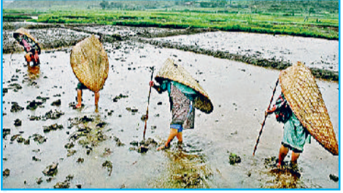
बांस के छते से खुद को भीगने से बचाते स्थानीय लोग

सवाल है आखिर मौसिनराम में दुनिया की सबसे ज्यादा बारिश कैसे होती है? जबकि दुनिया में सबसे ज्यादा बारिश वाली जगहें आमतौर पर भूमध्य रेखा के आस-पास होती हैं। दुनिया में भौगोलिक रूप से देखा जाए तो सबसे ज्यादा बारिश दक्षिण अमेरिका, मध्य-पश्चिमी अफ्रीकी देशों और कुछ दक्षिण-पूर्वी एशिया के देशों में होती है। फिर मौसिनराम ने दुनिया में सबसे ज्यादा बारिश की बाजी कैसे मार ली? इसका जवाब है कि आमतौर पर मई से सितंबर तक यहां जो बारिश होती है, उसका सबसे बड़ा कारण इस गांव की अपनी खास भौगोलिक स्थिति है। शिलांग से लगभग 60 से 65 किलोमीटर दूर उत्तर पूर्वी दिशा में खासी पहाड़ियों के बीच बसा यह गांव अपनी विशेष स्थिति के कारण दक्षिण-पश्चिम मानसून के दौरान पानी से भरी बदलियों का डेरा बन जाता है। खासी पहाड़ियों की खास स्थिति इन पानी से भरी बदलियों को आवभगत के लिए रोकती है और ठीक तभी बंगाल की खाड़ी से आने वाली गर्म और नम हवाएं इन्हें यहां झूमकर बरस जाने के लिए मजबूर कर देती हैं। 1491 मीटर