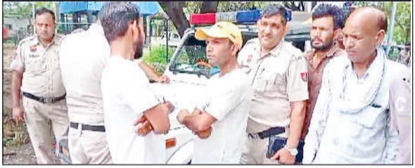
सोनीपत। डायल-112 की टीम कागजी कार्यवाही करते हुए।

डायल -112 पर कॉल कर पुलिस को बुलाया, थाने में दी शिकायत हरिभूमि न्यूज़ ▶▶ सोनीपत