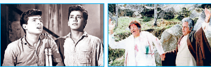
'दोस्ती' ने कायम की फिल्मों की मिसाल

अलग ढंग से पेश किया गया। 'हेराफेरी', 'मुकद्दर का सिकंदर' में अमिताभ और विनोद खन्ना की दोस्ती दिखाई गई। 'दोस्ताना' में शत्रुघ्न सिन्हा के साथ अमिताभ की दोस्ती मिसाल के रूप में याद की जाती है। 'शोले' में जय (अमिताभ बच्चन) और वीरू (धर्मद) की दोस्ती को कौन भूल सकता है भला! अमिताभ और धर्मद की दोस्ती बाद में 'चुपके-चुपके' और 'राम बलराम' जैसी फिल्मों में भी दिखी। राजेश खन्ना के साथ अमिताभ ने 'आनंद' और 'नमक हराम' में दोस्ती को जीवंतता दी। शशि कपूर के साथ 'ईमान धरम' और 'सुहाग' जैसी फिल्मों में अमिताभ ने यही दोस्ती निभाई।