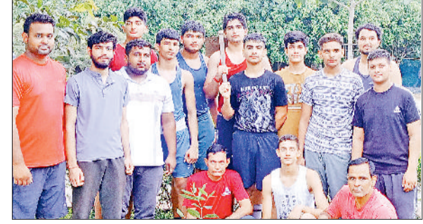
सोनीपत। अभियान के तहत इंडस्ट्री एरिया पार्क में पौधरोपण करते हुए।