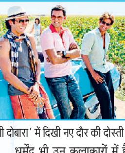
'जिंदगी न मिलेगी दोबारा' में दिखी नए दौर की दोस्ती

दोस्ती के बीच एक लड़की आ जाती है। फिर या तो गलतफहमी पनपती है या प्रेम त्रिकोण बन जाता है। क्लाइमैक्स में या तो गलतफहमी दूर हो जाती है या फिर एक दोस्त का त्याग सामने आता है। इस तरह की फिल्मों का चलन शायद राज कपूर, राजेंद्र कुमार की फिल्म 'संगम' से शुरू हुआ था। आगे चलकर इस तरह की कई फिल्में बनीं और सफल हुईं। यादगार है 'सौदागर' की दोस्ती: 1991 में सुभाष घई ने फिल्मों दुनिया के दो दिग्गजों दिलीप कुमार और राज कुमार को दोस्ती की डोर में बांधा और फिल्म बनाई-सौदागर। इस फिल्म की गिनती