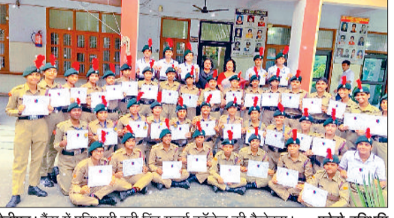
सोनीपत। कैप में प्रतिभागी रही हिंदू गर्ल्स कॉलेज की कैडेट्स।