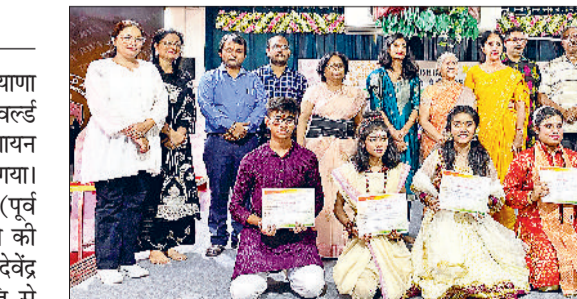
सोनीपत। विजेता विद्यार्थियों को सम्मानित करते भाविव पदाधिकारी एवं अतिथिगण।