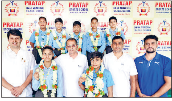
खरखौदा। खिलाड़ियों का स्वागत करते हुए प्रताप स्कूल प्रबंधन।

कहा प्रतियोगिता युवाओं के मन में नई ऊर्जा और आत्मविश्वास का संचार करेगी। उद्घाटन सत्र के बाद प्रारंभ हुई लॉन टेनिस प्रतियोगिता में खिलाड़ियों ने उम्दा खेल का प्रदर्शन किया। आयोजन समिति द्वारा खिलाड़ियों के लिए आवास, भोजन, चिकित्सा, एवं सुरक्षा जैसी सभी सुविधाओं की समुचित व्यवस्था की गई है। 4 अगस्त को विजेताओं को पुरस्कार व प्रमाण पत्र प्रदान किए जाएंगे।