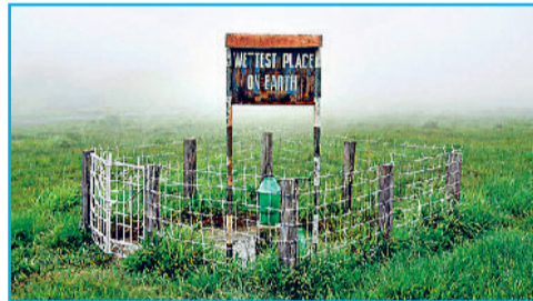
दुनिया का सर्वाधिक नम स्थान भी है मौसिनराम

ऊंची खासी पहाड़ियों के कारण ही इन बादलों की नमी संचयित होकर बारिश में बदल जाती है।